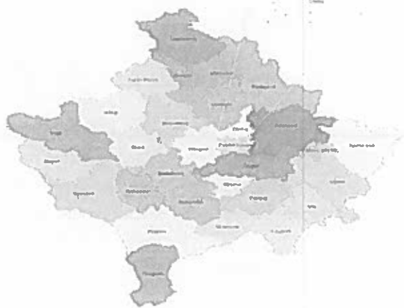
Pozita gjeografike e Komunës së Obiliqit